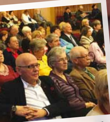
MAŁOPOLSKI DZIEŃ SENIORA

GRUDZIEŃ 2015 ISSN 2299-6990 www.glosseniora.pl